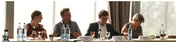
Bild: 8. Steuergruppensitzung im Café Grün auf der Jungviehweide, Illertissen

Der Erfolg der bereits umgesetzten LEADER-Projekten zeigt sich dadurch, dass vor allem Kooperationsprojekte bestrebt sind, Folgeprojekte an den Start zu bringen. Im Zuge des Projekts „ Flusslandschaften in Schwaben – Donau erleben! Und Wertach erleben! “ wurden bereits die Gewässerstrukturen verbessert und ökologisch aufgewertet. Nun soll dieses erfolgreiche Konzept ebenfalls an der Iller umgesetzt werden. Dazu werden derzeit durch die BEW für die Kommunen zwischen Buxheim und Vöhringen Modulpläne erstellt, die verschiedene Maßnahmen, wie beispielsweise naturnahe Ufergestaltung, beinhalten.